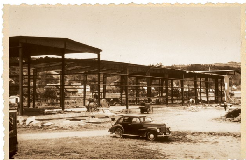
1962: строительство первого производственного здания

Вы можете задать свой вопрос на нашем сайте www.lindab.ru , воспользовавшись специальной формой в разделе Контакты, или отправить свой вопрос по адресу info.ru@lindabbuildings.com .