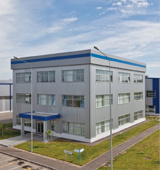
2011: завод Линдаб Билдингс в Ярославле