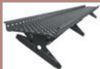
KTLAV - pro trapézové plechy a taškové tabule KTLAVC - pro Click a falcovanou krytinu