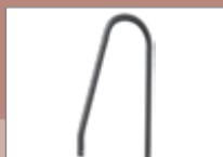
potřebný spojovací materiál: 2x KTM8-N 40 2x KTNUT-N