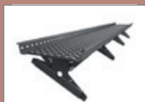
KTLAV - pro trapézové plechy a taškové tabule KTLAVC - pro Click a falcovanou krytinu