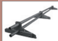
KTSNO - pro trapézové plechy a taškové tabule KTSNOC - pro Click a falcovanou krytinu