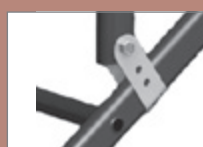
potřebný spojovací materiál: 1x KTM8-N 40 1x KTNUT-N