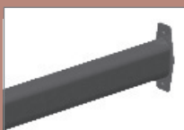
Pozn.: Šrouby pro kotvení do zdi nejsou součástí dodávky Průměr otvoru 10 mm