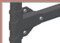
potřebný spojovací materiál: 2x KTM8-N 16 1x KTM8-N 40 3x KTNUT-N