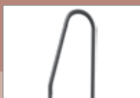
potřebný spojovací materiál: 2x KTM8-N 40 2x KTNUT-N