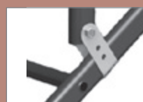
potřebný spojovací materiál: 1x KTM8-N 40 1x KTNUT-N