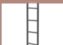
potřebný spojovací materiál při napojení žebříků: 2x KTM8-N 40 2x KTNUT-N