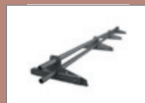
KTSNO - pro trapézové plechy a taškové tabule KTSNOC - pro Click a falcovanou krytinu